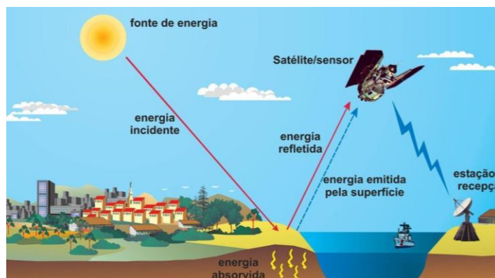
Figura 1. Aquisição de dados pelo Sensoriamento Remoto Orbital.

As figuras deverão ser mencionadas no texto, antes de sua apresentação (Figura 1).